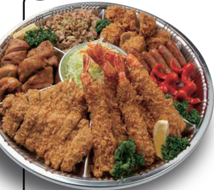
写真はLサイズです。

立山ポークを使用したお手頃なオードブルです。 みんなが集まるパーティーを豪華なごちそうでさらに楽しく。